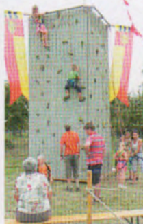
Kletterwand (oben) und Crêpe-Wagen (oben rechts) der Pfadi - ein Hit!