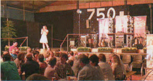
Auch am Samstag: Die Festhalle war prall gefüllt.