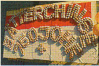
Der Stucki-Beck grüsste mit einer Brötchen-Sinfonie.