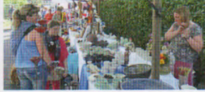
Marktbetrieb an der Stauffacherstrasse (links und rechts).