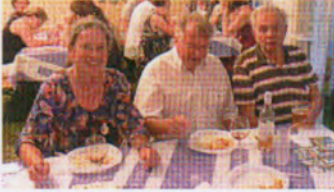
Auch in den Stuben herrschte reger Betrieb.