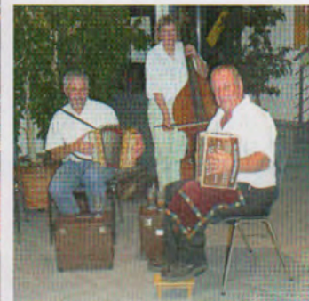
Volkstümliches in den Stuben.

Vorschau auf den Festumzug vom Sonntag: Der Aufruf zum Auftritt in nostalgischer Kleidung fand in der Bevölkerung Anklang.