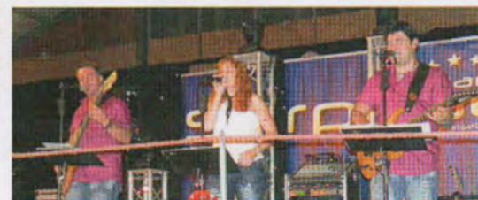
Die «Surprise-Band» als unterhaltender Vorbote von Michelles grossem Auftritt.